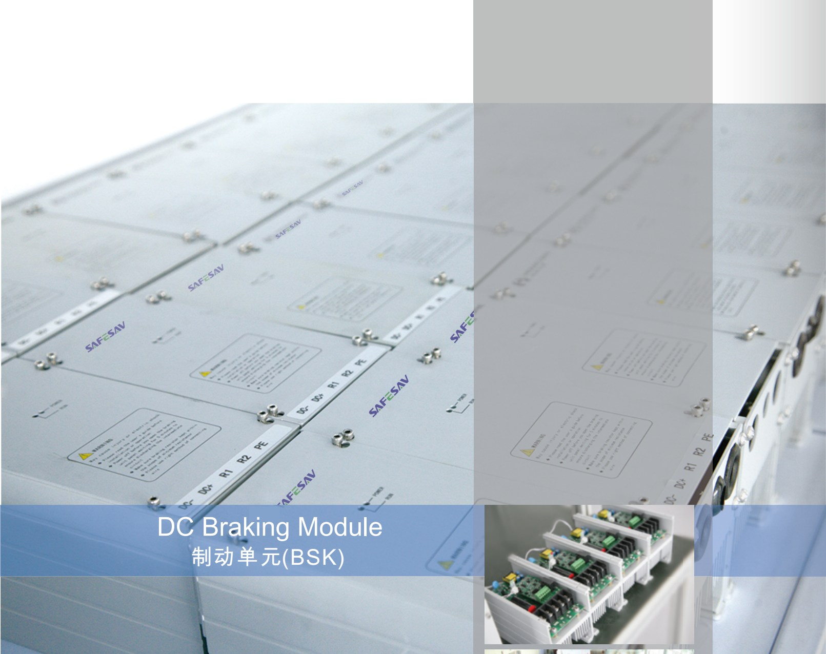
DC Braking Module 制动单元(BSK)